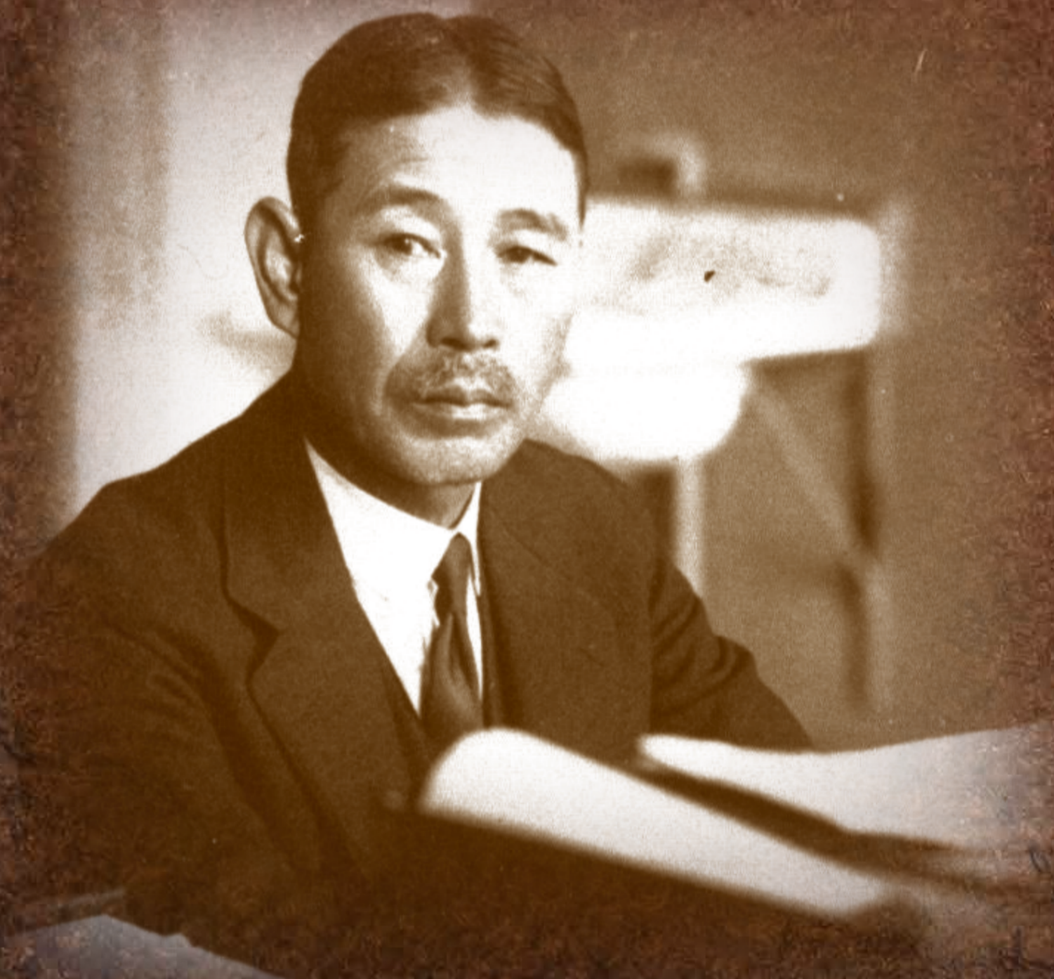
東北帝国大学 数学科初代教授 藤原松三郎